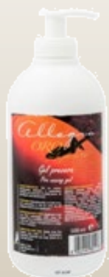
Очищающий гель перед депиляцией