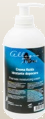
Увлажняющий крем после депиляции