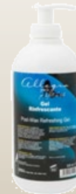
Освежающий гель после депиляции